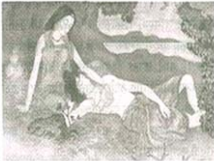
चित्र क्र. ४

आपला विषय स्त्री-पुरुष संबंध व नात्याचा आहे. ह्यावद्दल सर्वस्तर लेख मी 'दिशा' च्या ऑक्टोबर २००५ च्या अंकात छापला आहे.