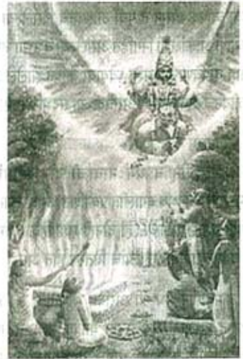
चित्र नं. १

दिशाच्या कांही शेवटच्या लेखात 'यज्ञ' ह्या वैदिक संकल्पनेवर कांही नूतन पुनरुज्जीवन करण्याच्या हेतूने मी मांडणी केली आहे व 'यज्ञ' संकल्पनेचा, जो त्यातील आध्यात्मिक व रहस्यात्मक आशावाचा व योजनेचा 'लोपलेला' - नाहीसा झालेला भाग, त्यावर जाणीवपूर्वक थोटा ठेवण्यासाठी प्रयत्न केला आहे.