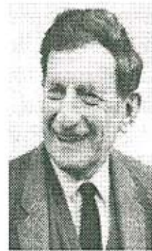
चित्र नं. ३ : David Bohm

This striking new picture of reality, the synthesis of Bohm and Pibram's views, has come to be called the "Holographic Paradigm."