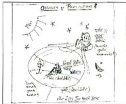
चित्र नं. - १ Observer or participant

“Observer and Participant” “Nothing is more important about the quantum principle than this, that it destroys the concept of the world as 'Sitting out there' with the observer