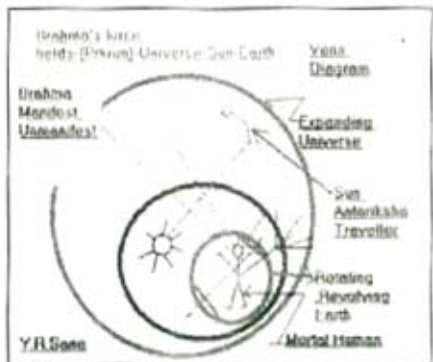
चित्र नं. ४

पृथ्वीवरच्या अस्तित्वाचा, आगमनाचा व निर्वाणाचा अर्थ जोपर्यंत निश्चित होत नाही तोपर्यंत समाजशास्त्राचा विचार हा अपूर्ण व तोकडा आणि दिशाहीन, अव्यक्त व भरकटणारा असाच असणार व रहाणार हे निश्चित. त्याची थोडी कल्पना "Life's Journey" ह्या चित्रावरून यावी. ह्या पृथ्वीच्या 'प्लॅटफॉर्मवर' सतत नवीन जीवांचे आगमन-जन्म व जवळजवळ १०० वर्षांच्या वास्तव्यानंतर बहिर्गमन होते ही परिस्थिती सतत डोळ्यासमोर ठेवली पाहिजे. अशा ह्या 'Temporary' अल्पकालीन वास्तव्याचाच एक "तात्पुरता समाज" बनत असतो व आपल्याला ह्या समाजाच्या संस्कारांचा, मूल्यांचा संस्कृतीचा अभ्यास अभिप्रेत आहे.