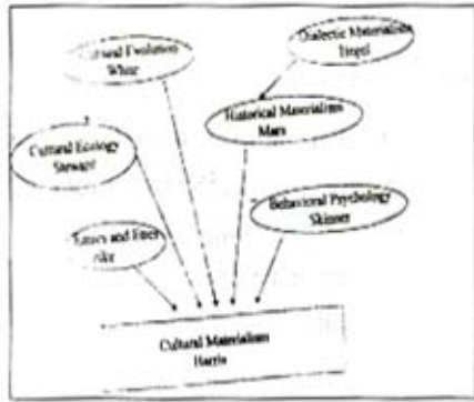
चित्र नं. १

हे चित्र काय दर्शविते? मिस्टर मारविन हॅरिस ह्यांच्या प्रसिध्द 'सांस्कृतिक भौतिकवाद' ह्या 'तत्त्वज्ञान' ह्या स्वरूपाच्या निष्कर्षांपर्यंत नेणाऱ्या समाजातील निरनिराळ्या पंडितांच्या किंवा विचारवंतांच्या संस्कृतीच्या घडणीबद्दल, कार्यकारण सूत्रांबद्दल मांडलेल्या विशेष अशा