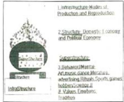
चित्र नं. २

झाल्या आहेत, तरी देखील आजच्या राजकीय, सामाजिक, सांस्कृतिक, शैक्षणिक प्रचलित पद्धती ह्याच विश्वासावर आधारलेल्या दिसतील. मारविन हॉरिस ह्यांच्या सांस्कृतिक भौतिकवादाचा आधारस्तंभ हा कार्ल मार्क्सच्या "इंफ्रास्ट्रक्चर, स्ट्रक्चर व सुपरस्ट्रक्चर" ह्या सिद्धांतावर आधारलेला आहे. ह्याचे चित्रमय स्वरूप सोवत छापले आहे. ह्यात आणखी एक बारकावा सांगावाच लागेल.