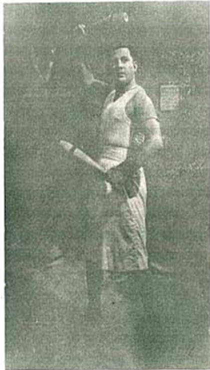
'ब्रह्मचारी' - मास्टर विनायक

भारताला स्वातंत्र्य मिळाल्यावर महाराष्ट्र राज्य निर्मितीनंतर मराठी बोलपटांना भरभराटीचा काळ येईल