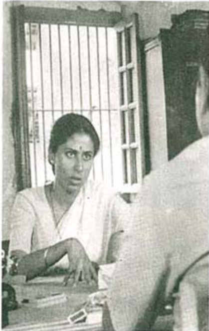
'उंबरठा' - स्मिता पाटील

६ फेब्रुवारी १९३२ रोजी मॅजेस्टिक सिनेमात