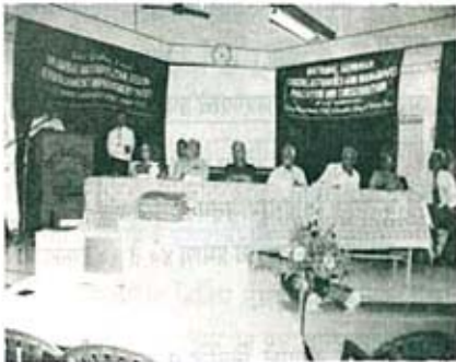
उद्याटन प्रसंगीचे दृश्य

५. खाडी व नदीमुखाच्या भागात साठलेला कचरा, गाळ काढून टाकून भरती ओहोटीचे पाणी विना अडसर वाहू देण्यासाठी उपाय करणे. यामुळे खाड्यांमध्ये सांडपाणी व कचरा साठून राहणार नाही.