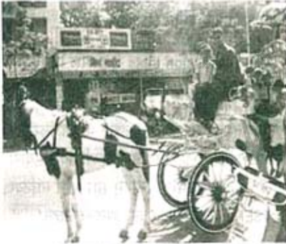
टांग्यात मजा करताना लहान मुले.

शुक्रवार दिनांक २२-३-२००२ रोजी पूर्व प्राथमिक विभागातील मोठा शिशु वर्गाला आगळावेगळा निरोप समारंभ देण्यात आला. निरोप समारंभ शाळेत साजरा न करता या दिवशी २७६ मुलांना मासुंदा तलावपाळी येथे दुपारी २.३० वाजता नेले. त्यानंतर मुलांना सजवलेल्या वगांत वसवून मासुंदा तलावाला पूर्ण फेरी केली.