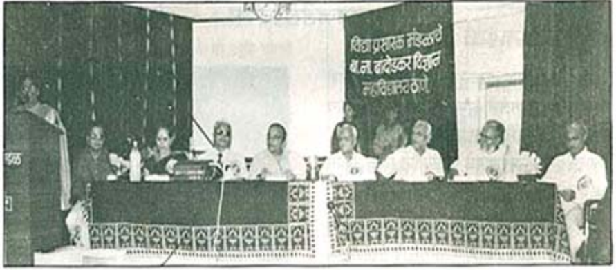
आय. टी. च्या उद्घाटन प्रसंगी व्यासपिठावरील मान्यवर.