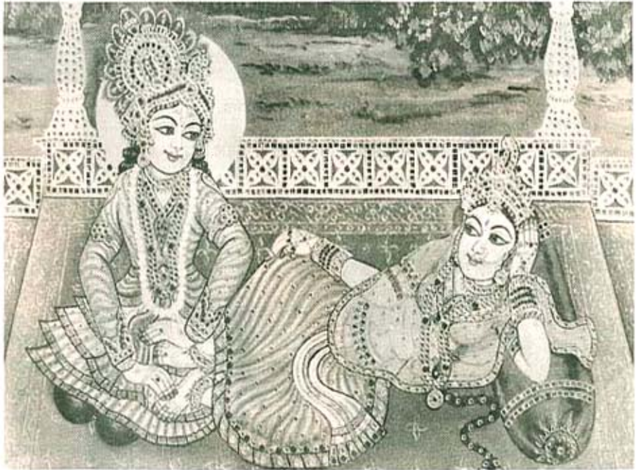
पुरातन वास्तू- वाडे मंदिरे यांतील ही भिंती चित्रं.

जेथे बुद्धीचे क्षेत्र संपते, येथे श्रद्धेचे क्षेत्र सुरु होते.