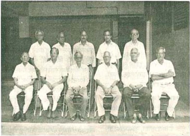
कार्यकारिणी मंडळ - विद्या प्रसारक मंडळ १९९९ - २०००

ऑगस्ट १९ च्या अंकामध्ये विद्या प्रसारक मंडळाच्या १९९९ - २००० वर्षांसाठी निवडण्यात आलेल्या कार्यकारिणीच्या सदस्यांची नावे फोटोसह दिली होती. त्यांत उभ्या असलेल्या सभासदांच्या नावामध्ये चूक शाली. त्यावद्दल दिलगिरी व्यक्त करून कार्यकारिणीचा तोच फोटो परत छापत आहोत. झालेल्या चुकीवद्दल क्षमस्य ! - संपादक