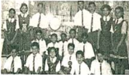
कुमार कला केंद्रात चमकलेले विद्यार्थी

नृत्य - माध्यमिक विभागाने सादर केलेल्या 'संघर्ष नृत्यास' प्रथम क्रमांक प्राप्त झाला.