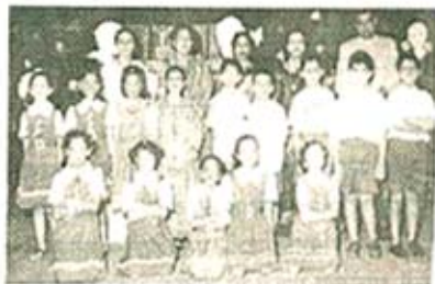
'ऐरा गैरा नव्थू खैरा' यातील कलाकार मार्गदर्शक शिक्षकांसह

जानेवारी ७ व ८ रोजी या शाळेचे स्नेहसंमेलन संपन्न झाले. या कार्यक्रमांतील वैशिष्ट्य म्हणजे भारतीय पारंपरिक नृत्य गायनापासून ते पारचात्य नृत्यापर्यंतच्या सुंदर मिलाप या संमेलनात होता.