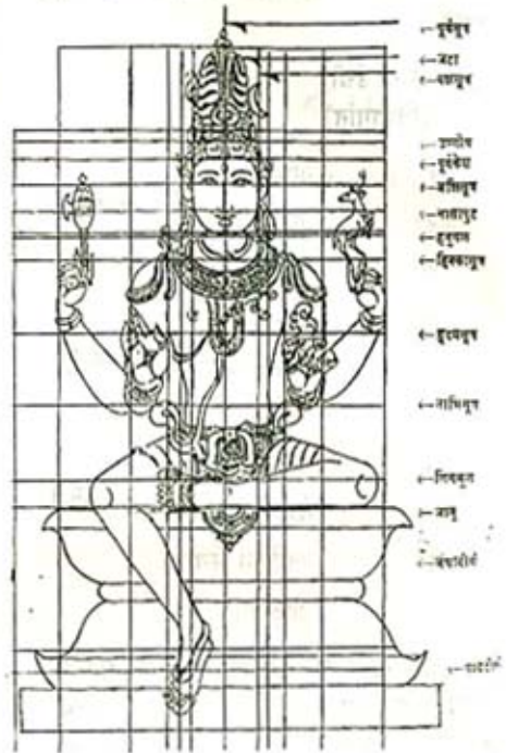
आकृती २ : सुखासन मूर्ती मूर्ती घडविण्यासाठी सूत्रे

शिवाय उभ्या सूत्रांचा देखिल वापर करतात. ही एकूण नऊ सूत्रे आहेत. ती देखील आकृती २ मध्ये दाखविली आहेत.