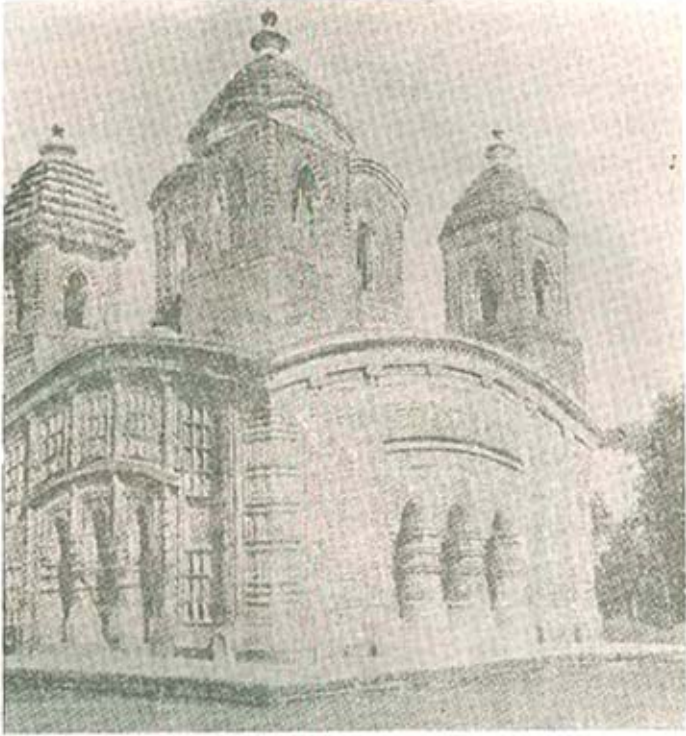
छायाचित्र - १

बोधगया येथील बुद्ध देवालय फार प्राचीन असून (इ.पूर्व सहावे शतक ?) त्याची उंची ५४.८ मी. आहे. त्याच्याउपवीठाच्या चारी कोपऱ्यांवर मधल्या मुख्य देवालयाच्या प्रतिकृती असे प्रत्येकी एक देवालय नंतर बांधले गेले. देवालयाच्या आवारात अनेक स्तूप असून शिवाय सम्राट अशोकाचा स्तंभ तेथे आहे. त्यावर सिंहमूर्ती आहे. स्तंभाच्या दोन्ही बाजूंवर दोन यक्षांच्या भव्य मूर्ती आहेत.