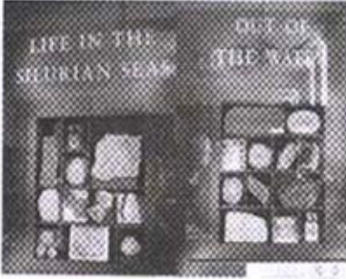
वेगवेगळ्या खडकांचे नमुने

भागांत जमिनीवर आढळणाऱ्या खडकाचे नमुनेदेखील येथे ठेवलेले आहेत. त्यात उत्तर अमेरिका, युरोप, आशिया, आफ्रिका अशा वेगवेगळ्या खंडातील दगडांचे नमुने आहेत. एक खंड जरी घेतला तरी त्यात किती विविधता आढळते! ही सगळी विविधता आपल्याला एकाच ठिकाणी पाहायला मिळते.