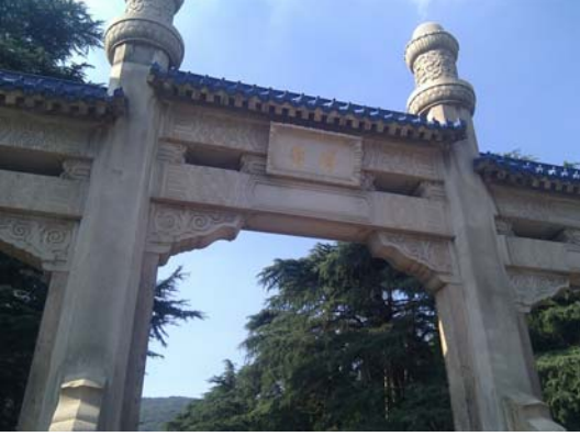
समाधीचे प्रशस्त असे प्रवेशद्वार

पोहोचलो. ते सन यात सेन यांच्या समाधीचे प्रवेशद्वार होते. तेथून दूर अंतरावर एक सुंदर इमारत दिसते. तिथपर्यंत पोहोचण्यासाठी सुमारे ३०० पायऱ्या चढाव्या लागतात.