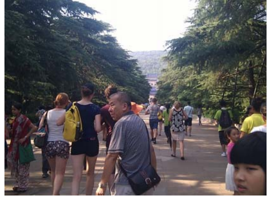
समाधीचे दुरून दर्शन