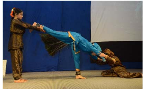
रिशी व्हॅली शाळेतील विद्यार्थ्यांनी सादर केलेला सांस्कृतिक कार्यक्रम