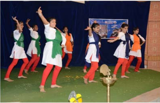
जोशी-बेडेकर महाविद्यालयाच्या विद्यार्थ्यांनी सादर केलेला सांस्कृतिक कार्यक्रम