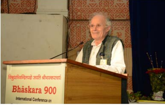
फ्रेंच प्राध्यापक फिलिओज्जा आपले विचार मांडताना