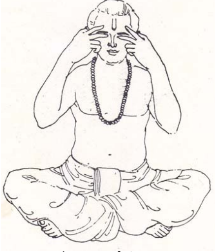
पंथराज चतुर्मुखी मुद्रा