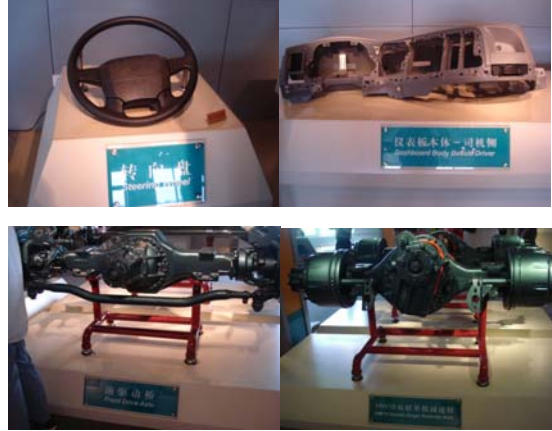
ट्रकचे वेगवेगळे भाग

आवारात प्रवेश करायला मुळीच वेळ लगला नाही. सर्वांत आधी एका सभागृहात बसवून चित्रफितीच्या सहाय्याने तेथील आधिकाऱ्यांनी आम्हांला माहिती दिली. त्यानंतर प्रत्येकाला हेल्मेट देऊन कारखाना दाखवायला घेऊन गेले. कारखान्यात येणाऱ्या व्यक्तींना माहिती देण्यासाठी चांगले प्रदर्शन आयोजित करण्यात आले आहे. प्रदर्शनाच्या पहिल्या दालनात आम्ही शिरलो. या दालनात ट्रकचे वेगवेगळे भाग ठेवलेले आहेत. प्रत्येक भागाजवळ त्याची माहिती लिहिलेली आहे. आपण पूर्ण झालेला ट्रक एकसंध पाहतो. त्यात एवढे वेगवेगळे भाग असतात याची आपल्याला कल्पना देखील येत नाही. इंजिन, गिअरबॉक्स, चाके, ब्रेकची व्यवस्था, इंजिनपासून चाकापर्यंत गती घेऊन जाणारा भाग, ट्रकचा आधार (चासी), ट्रकमधील स्प्रिंग, त्यातील प्रकाशयंत्रणा, ड्रायव्हरसाठी बसण्याची खुर्ची, ट्रकचे आच्छादन, त्यातील बॅटरी असे अनेक भाग तेथे क्रमाने आणि अतिशय पद्धतशीरपणे ठेवलेले होते.