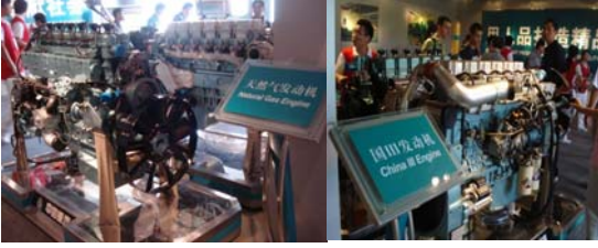
दोन वेगवेगळी इंजिने

स्वयंचलित यंत्राचा सगळ्यात महत्त्वाचा भाग म्हणजे त्याचे इंजिन. या इंजिनात अनेक सुधारणा होत गेल्या. म्हणून केवळ इंजिनासाठी एक वेगळे दालन तेथे निर्माण केलेले आहे. यात इंजिनाचा विकास कसा झाला यापासून वेगवेगळ्या कंपन्यांची इंजिने कशी असतात याची माहिती मिळते. त्याचबरोबर वेगवेगळ्या वाहनात कोणते इंजिन वापरतात याचीही माहिती मिळते. हे प्रदर्शन पाहताना अंतर्गत ज्वलन इंजिनाचे (Internal Combustion Engine) चांगले ज्ञान आपल्याला मिळते. महाविद्यालयीन स्तरावर भौतिक शास्त्र शिकताना या बाबीचा मी अभ्यास केला होता. परंतु ते शिक्षण पूर्णपणे खडू फळ्यावर आधारलेले होते. एवढ्या वर्षांनंतर मी त्या सगळ्या बाबींचा प्रत्यक्ष अनुभव घेत होतो. त्यामुळे पुनःप्रत्ययाचा आनंद मला लाभत होता.