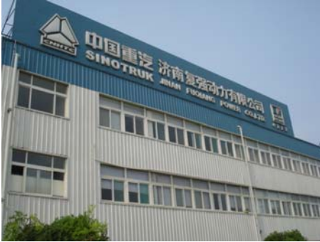
कारखान्याची भव्य इमारत

विज्ञान प्रदर्शनात सहभागी होण्यासाठी आम्ही जेव्हा चीनला जातो तेव्हा तेथील आयोजक काही प्रेक्षणीय तथा धार्मिक स्थळाला भेट आयोजित करतात. जीनान येथील आयोजकांनी देखील तेच केले. पण त्याचबरोबर त्यांनी एका कारखान्याला भेट आयोजित केली. हा कारखाना ट्रकची निर्मिती करतो आणि त्याचे नाव सायनोट्रक फॅक्टरी (Sinotruck Factory) असे आहे. जीनान शहराच्या जवळ जेथे औद्योगिक क्षेत्र आहे तेथे हा कारखाना उभारलेला आहे. तेथे जाण्यासाठी अर्थातच आम्हांला गावाच्या बाहेर पडावे लागले. गावाच्या वेशीवर येताच आम्हांला प्रशस्त असे बंदिस्त क्रीडांगण पाहायला मिळाले त्यानंतर थोडी मोकळी जागा आहे. या जागेवर शेती करण्यात येते. साधारणपणे १०-१५ किलोमीटरवर एक भलीमोठी औद्योगिक वसाहत आहे. याच वसाहतीत सायनोट्रकचा कारखाना आहे.