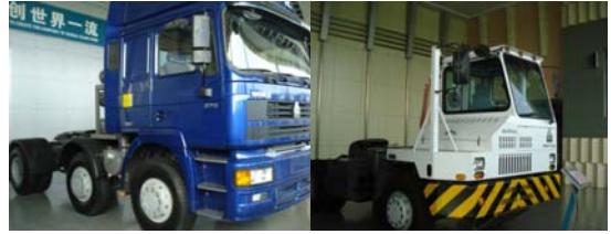
पूर्ण झालेले दोन ट्रक

ट्रकचा सांगाडा आला की पहिल्या गटातील लोक त्याला चाके लावतात, दुसऱ्या गटातील लोक त्याला इंजिनापासून चाकापर्यंत गती आणणारा दांडा बसवितात, तिसरा गट विजेची यंत्रणा बसवतो, चौथा गट आच्छादन आणि खुर्ची बसवतो, पाचवा गट इंजिन बसवतो, सहावा गट टायर बसवतो आणि सातवा गट ट्रक रंगवितो. यांतील थोडेसेच काम यंत्राद्वारे होते. बरेच काम माणसाद्वारे केले जात होते. इमारतीच्या सुरुवातीला केवळ एक सांगाडा येतो तर इमारतीच्या टोकाला एक पूर्ण ट्रक बाहेर पडतो. यांतील सगळी कामे इतकी पटापट होतात की काही वेळातच ट्रक पूर्ण होतो. त्या ठिकणाहून बाहेर पडतो, तोच आपल्याला पूर्ण झालेले अनेक ट्रक पाहायला मिळतात.