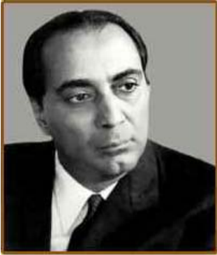
होमी जहांगीर भाभा

“मला आयुष्याकडून काय हवे आहे, हे मला अतिशय स्पष्टपणे माहीत आहे. केवळ आयुष्य आणि माझ्या भावना या दोघांबाबत मी सावध आहे. माझे आयुष्यातील सावधपणावर प्रेम आहे आणि मला तो जेवढा मिळू शकेल तेवढा हवाच आहे. मात्र आयुष्यकाळ मर्यादित असतो. मृत्यूनंतर काय, हे कुणालाही माहीत नसते. मला त्याची फिकीरही नाही. अर्थातच मी आयुष्यकाळ वाढवून त्यातील आशय वाढवू शकत नाही. मात्र मी आयुष्याची प्रखरता वाढवून त्याचा आशय वाढवेन कला, संगीत, काव्य आणि इतरही सर्व बाबतींतल्या माझ्या सावधानतेचा उद्देश, आयुष्यातील सावधानतेची प्रखरता वाढवणे हाच असतो.”