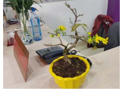
पर्यटन कार्यालयाच्या टेबलावर ठेवलेले बोनसाय

बनवून विक्रीसाठी ठेवले जातात. या प्रकाराची सुरुवात जरी जपानमध्ये झाली तरी बोनसायचे लोण सगळीकडे पसरले आहे. व्हिएतनाममध्ये बोनसायला वेगळेच महत्त्व आहे. तेथे बोनसायला समृद्धीचे लक्षण मानले जाते. म्हणूनच नववर्षाच्या निमित्ताने त्याची खरेदी केली जाते. आपल्याकडे असलेली समृद्धी दाखविण्यासाठी त्याचे प्रदर्शन करण्याची तेथे प्रथा आहे. केवळ नववर्षालाच नव्हे तर वर्षभर आशा बोनसायला कामाच्या टेबलावर ठेवण्याची प्रथा तिथे प्रचलित आहे.