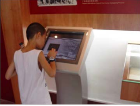
माहिती देण्यासाठी तंत्रज्ञानाचा उपयोग

प्रेक्षणीय स्थळाच्या मध्यभागी जी इमारत आहे ती प्रामुख्याने सभागृहाची इमारत आहे. तेथे पुढारी आणि कार्यकर्ते यांच्या सभा होत असत. नवीन स्वयंसेवकांना प्रबोधन येथेच दिले जाई. या सभांचे स्वरूप कसे होते याचे चित्ररूप प्रदर्शन आपल्याला या इमारतीत पाहायला मिळते. इमारत जुन्या पद्धतीची असून चीनी देवळे ज्या पद्धतीने बांधली जातात त्याच पद्धतीने या इमारतीचे काम करण्यात आलेले आहे. बाहेरून ही इमारत अतिशय सुंदर दिसते. चीनी क्रांतीचे उगमस्थान म्हणून या ठिकाणाकडे पाहता येईल. चीनी राज्यकर्त्यांनी या स्थळाचे चांगले जतन केलेले आहे. विशेष म्हणजे त्या वेळच्या क्रांतीच्या जनकाची तत्त्वे त्यांनी पूर्णपणे सांभाळली नाहीत. गरजेप्रमाणे त्यांनी त्यात सुधारणा केली आणि बदल केले तरीही समाजवादाचा मूळ ढाचा त्यांनी बदललेला नाही.