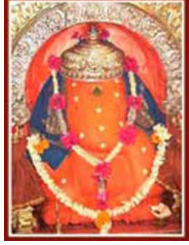
मोरगांवचा श्री मयूरेश्वर

गणेशभक्त मोरया गोसावी यांनी येथील पूजेचा वसा घेतला होता. स्वयंभू व आद्यस्थान असलेली ही गणेशाची मूर्ती आहे. प्रत्येक घरा-घरात म्हटली जाणारी 'सुखहर्ता दुःखहर्ता' ही गणपतीची आरती श्री समर्थ रामदास स्वामींना याच मंदिरात स्फुरली असे म्हटले जाते. मंदिराचे बांधकाम