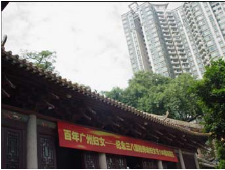
जुने मंदिर आणि नवीन गगनचुंबी इमारत

किशोरांसाठी आयोजित केलेल्या नवनिर्मिती स्पर्धेत भाग घेण्यासाठी आम्ही गॉॅच्यू येथे गेलो होतो. आमच्या खेरीज आणखी ११ देशांतील स्पर्धक या स्पर्धेत सहभागी होण्यासाठी आले होते. या ११ देशांतील पाहुण्यांना संयोजकांनी खास सुविधा पुरविल्या होत्या. स्पर्धेबरोबर शहराची आणि आजूबाजूच्या परिसराची माहिती पाहुण्यांना व्हावी यासाठी स्पर्धेतून सवड काढून सहल आयोजित करण्यात येते. स्पर्धेची सुरुवात सोमवारी व्हायची होती. रविवार हा तयारी करण्याचा आणि प्रकल्प लावण्याचा दिवस होता. हे काम लवकर आटपा, म्हणजे जेवणानंतर आपण शहरात फेरफटका मारून येऊ असे आम्हांला संयोजकांनी बजावले होते. त्यांच्या सूचनेनुसार आम्ही प्रदर्शनाच्या ठिकाणी सकाळी लवकर पोहोचलो आणि जेवणाची वेळ होण्याच्या आधी आपले काम आम्ही संपविले. ठरल्याप्रमाणे हॉटेलवर येऊन आम्ही दुपारचे जेवण आटोपले. त्यानंतर शहरातील नांगजियांग सुओ (Nangziyang Suo) या महत्त्वाच्या स्थळाला भेट देण्यासाठी निघालो.