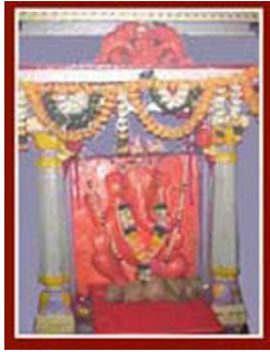
महडचा गणपती वरद विनायक

पालीहून ३८ किमी वर खोपोलीपासून १.५ कि.मी. अंतरावर महड या ठिकाणी गेलो. महडचा गणपती वरद विनायक नावाने प्रसिद्ध आहे. या मंदिरा संदर्भात एक कथा आहे की एका भक्ताला स्वप्नात देवळाच्या मागील बाजूस असलेल्या तळ्यात पडलेली मूर्ती दिसली त्याप्रमाणे त्या भक्ताने शोध घेतला व मूर्ती मिळाली तीच या मंदिरातील प्रतिष्ठापना केलेली मूर्ती होय. मंदिरात दगडी महिरप असून गणेशाची मूर्ती सिंहासनारूढ आहे. हा गणपती उजव्या