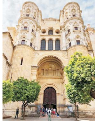
मालगा कॅथेड्रल आणि बाहेरची संत्र्यांची बाग

वाट पहातोय. इतिहासाचा उपयोग हा चुकांची पुनरावृत्ती टाळण्यासाठी करायचा असतो - एकमेकांच्या उखाळ्यापाखाळ्या काढण्यासाठी किंवा एकमेकांचा दुःस्वास करण्यासाठी नव्हे! इतरांच्या इतिहासातूनही आपल्याला बरेचदा शिकता येतं. त्यासाठी डोळे नाही तर नजर लागते, हेच आज आपण दुदैवानं विसरत चाललो आहोत. ज्या दिवशी हे आपल्याला उमगेल तो सुदिन!