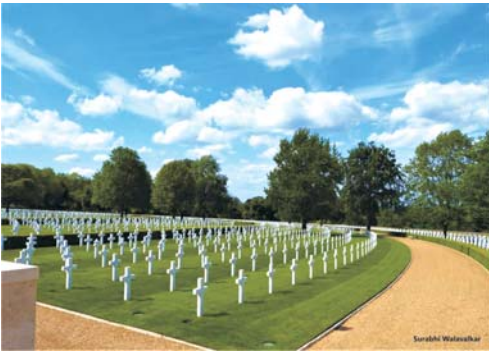
त्याचबरोबर बस मधूनच फिट्झविलियम म्युझियम,

या सिटी साईटसिइंमध्ये विशेष आकर्षण जे जाणवलं ते म्हणजे अमेरिकन सिमिट्री. एखाद्या देशाची ताकद किती असू शकेल याचा अंदाज आपल्याला येऊ शकतो. दुसऱ्या महायुद्धातल्या आपल्या शत्रू राष्ट्रामध्ये स्वतःच्या देशाचा एक भू भाग आणि त्यावर २३ मीटर उंच असा फ्लॅग पोल ज्यावर अमेरिकेचा झेंडा अगदी थाटात मिरवत फडकतोय. थोडक्यात आम्ही यु. के. मध्ये जाऊन अमेरिकेच्या जमिनीवर उभे होतो. अविस्मरणीय अनुभव, दृष्य आणि अंगावर काटा आणणारी वास्तववादी कथा.