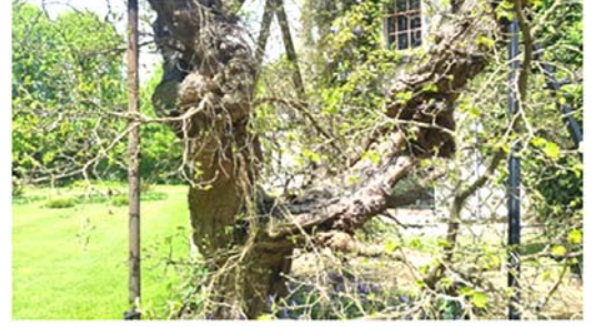
घरामागे असलेले एक जुने झाड

कार्य दाखविणारी चित्रफीत निर्माण केली. ती देखील या स्मारकात उपलब्ध करून देण्यात आली आहे.