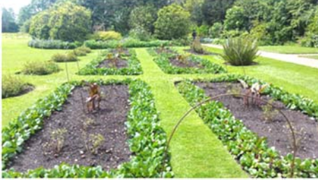
घराबाहेर असलेली सुंदर बाग

बराच वेळ लागतो. त्यात संपूर्ण दिवस जातो. आम्हाला मात्र ही भेट अर्ध्या दिवसात संपवायची होती. त्यामुळे इमारतीच्या आत असलेले प्रदर्शन पाहून आम्ही बाहेरचे प्रदर्शन पाहायला बाहेर पडलो.