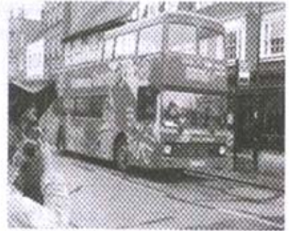
केम्ब्रिज टूर बस

व्यक्तीने आम्हांला दिली. आजूबाजूचे निरीक्षण करीत आम्ही बस येण्याची वाट पाहू लागलो. आम्हांला जास्त वेळ ताटकळत बसावे लागले नाही. थोड्याच वेळात "बस आली, बस आली" असा गलका विद्यार्थ्यांनी केला. ही बस ओळखायला फार सोपी आहे. लाल रंगाने रंगविलेल्या या बसवर (Cambridge Tour) असे ठळकपणे लिहिलेले असते.