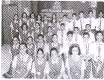
सी. ए. के जोशी इंग्लीश मिडियम स्कूल ठाणे, माध्यमिक शिष्यवृत्तीधारक

खालील विद्यार्थ्यांना शहरी विभागातून शिष्यवृत्ती मिळाली.