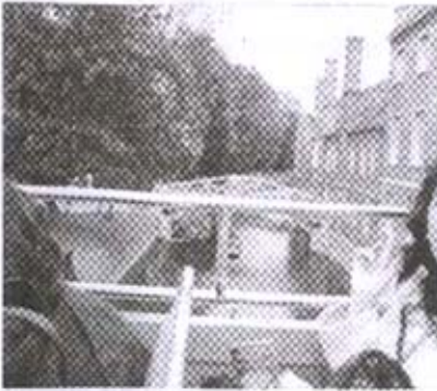
नदीवरील भौमितीय पूल

बसस्टॉपवर आम्हांला फार वेळ थांबावे लागले नाही. थोड्याच वेळात केंब्रिज टूरची दुसरी बस आली. परत त्या बसच्या वरच्या मजल्यावर आम्ही जाऊन बसलो आणि आमची सहल पुनश्च सुरू झाली. बस आता जुन्या वस्तोतून जाऊ लागली. दोन्ही बाजूला दगडाने बांधलेल्या जुन्या इमारती होत्या. ह्या इमारतींमध्ये केंब्रिज विद्यापीठाची कॉलेजेस् आहेत असे गाईडने सांगितले. अशा अनेक कॉलेजचे मिळून केंब्रिज विद्यापीठ तयार झाले आहे. सेंट जॉन्स कॉलेज, क्रीन्स कॉलेज अशी अनेक कॉलेजेस मागे टाकत बस प्रसिद्ध केंब्रिज पुलावर आली. या पुलावर बस थांबताच आम्ही सर्वजण खाली उतरलो. आजूबाजूचा परिसर पर्यटकांनी गजबजून गेला होता. कॅम या नदीवर बांधलेला हा पूल आहे. खरे तर कॅम नदीवर बांधलेला ब्रिज या अधिनि गावाला केंब्रिज असे नाव पडले आहे. केंब्रिज नदीतून अनेक बोटी जात असलेल्या आपल्याला दिसतात. याला पंटींग असे म्हणतात. अनेक पर्यटक शुल्क देऊन नदीतून बोटीने फेरफटका मारून येतात. या पुलाच्या शेजारीच एक लाकडी पूल आहे. त्याला भौमितीय पूल (Geometrical Bridge) असे म्हणतात. पुलावरील दृश्य पाहून झाल्यावर आम्ही परत बस स्टॉपवर आलो आणि मागच्या बसची वाट पाहू लागलो.