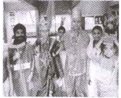
'एकलव्य' मधील कलाकार

गुरुपौर्णिमेच्या दिवशी गुरुविषयी असलेला आदरभाव दर्शवीत प्राथमिक विभागाच्या विद्यार्थ्यांनी 'एकलव्य' ह्या गुरू व शिष्याची गोष्ट नाटकाद्वारे सादर केली. तसेच, श्लोकांद्वारे सर्वांच्या कल्याणासाठी प्रार्थना केली.