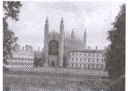
किंग्ज कॉलेज, चॅपेल

लपकरच बस आली आणि आमची पुढची सहल सुरू झाली. गाईडने लगेच सांगितले की बसच्या पुढे असलेले कॉलेज डार्विन कॉलेज असून उजवीकडच्या कॉलेजचे नाव क्रीन्स कॉलेज असे आहे. काही मीटर पुढे गेल्यावर बस उजवीकडे वळली. बस वळताच गाईडने आम्हांला आपले कॅमेरे तयार ठेवायला सांगितले. आमचे प्रत्येकाचे कॅमेरे तयार होतेच. तरीही एका महत्वाच्या ठिकाणाचे दर्शन होणार आहे यासाठी कॅमेरे तयार ठेवा असे गाईडला सुचवायचे होते. बस उजवीकडे वळून कॅम नदीला समांतर जाऊ लागली. नदी आणि रस्ता यांमधील जागा मोकळी असून त्यावर चांगलेच गवत वाढविले होते. गवताच्या भोवताली मोठमोठाली झाडे आहेत. आमची सहल मे महिन्यात होती. त्यामुळे सर्व झाडांना नवीन पालवी आलेली होती. जवळ गवताळ पटांगण, त्यापुढे नदी आणि दूरवर कॉलेजच्या इमारती असे दृश्य पाहात आम्ही पुढे चाललो होतो. तेवढ्यात एकदम गलका झाला. एक अतिशय सुंदर दृश्य आमच्या नजरेस पडले. दोन झाडांच्यामधून दिसणारे भव्य चर्च असे ते दृश्य होते. हे किंग्ज कॉलेजचे चर्च असल्याचे गाईडने आम्हांला सांगितले. आम्ही सर्वांनीच पटापट फोटो काढले. बस पुढे जात राहिली. थोड्याच वेळानंतर केंब्रिज विद्यापीठ ग्रंथालयाचा थांबा आला. या थांब्यावर आम्ही बसमधून उतरलो.