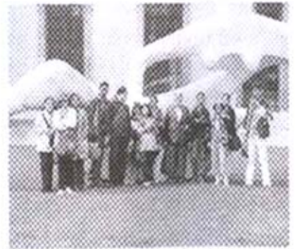
संग्रहालयाच्या समोर घेतलेले छायाचित्र

वजू लागली. तेव्हाच गाईडने आम्हांला पुढे बघायला सांगितले. बघतो तर सर्वत्र झाडेच झाडे. हा कॅंब्रिजच्या बोटनिकल गाईडचा परिसर असल्याचे त्याने सांगितले. कोणाला उतरायचे असेल उतरू शकता, अशी सूचना ही गाईडने केली. परंतु ऑक्सफर्ड बोटनिकल गाईड आम्ही पाहिले असल्याने कॅंब्रिजचे गाईड पाहण्याचे नाही असे आम्ही ठरविले होते. म्हणून आम्ही बसमध्येच बसून राहिलो. बस पुढे जात राहिली. गाईडचे मार्गदर्शन सुरूच होते. कॅंब्रिज शहरावद्दल तो माहितो देत होता. थोड्याच वेळानंतर आणखी एक थांबा आला. हा थांबा फिट्झ विल्यम संग्रहालयाचा असल्याचे जेव्हा आम्हांला कळले तेव्हा तेथे उतरायचे ठरविले. आमच्या बसमधील बहुतेक सर्वजण या थांब्यावर उतरले. तिथे बसची वाट पाहणारे प्रवासी बसमध्ये चढले आणि आमची बस निघून गेली. फिट्झ विल्यम संग्रहालय आकाराने विस्तीर्ण आहे. येथे धातू, काच, चिनीमातीच्या अनेक सुंदर सुंदर वस्तू ठेवलेल्या आहेत. तळमजला संपूर्ण धातूच्या वस्तूसाठी, वरचा मजला चिनीमातीच्या वस्तूसाठी आणि सर्वात वरचा मजला रंगीत चित्रांसाठी वापरला आहे. साधारणपणे तसभर संग्रहालयात फिरून आम्ही बसस्टॉपवर परत आलो. फिट्झ विल्यम भेटीवर एक स्वतंत्र लेख लिहिण्याचा विचार आहे.