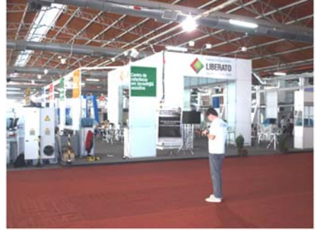
फेर्नॅक मधील प्रचंड मोठी जागा

शहरात फिरताना दोन गोष्टी प्रामुख्याने लक्षात येतात. एकतर शहरातील स्वच्छता. रस्त्यावर पडलेला कचरा किंवा भरून ओसंडून वाहणारी कचरा कुंडी आम्हाला