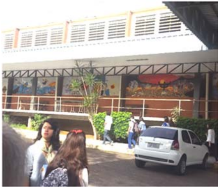
फंडासाव लिबरटोची सुबक इमारत

नोवो हँबुर्गो (Novo Hamburgo) हे ब्राझील देशाच्या दक्षिण भागात वसलेले एक लहानसे शहर आहे. या शहरात फंडासाव लिबरटो (Fundacao Liberato) नावाची तांत्रिक शिक्षण देणारी एक शैक्षणिक संस्था आहे. माध्यमिक शिक्षण पूर्ण करून विद्यार्थी या संस्थेत प्रवेश घेतात. आपल्याकडे जशा पॉलिटेक्निक असतात तशीच ही संस्था आहे. ही संस्था विद्यार्थ्यांच्या सर्जनशीलतेला उत्तेजन देण्यासाठी विज्ञान आणि तंत्रज्ञान या विषयांवर स्पर्धा घेते. १९८५ मध्ये त्यांनी या स्पर्धेचे प्रथम आपल्याच संस्थेत आयोजन केले. तेव्हापासून दरवर्षी ऑक्टोबर महिन्यात या स्पर्धेचे नियमितपणे आयोजन केले जाते. या स्पर्धेला मोस्ट्राटेक (Mostratec) असे नाव देण्यात आले आहे. या मालिकेतील ३० वी स्पर्धा नोवो हँबुर्गो शहरात २६ ते ३० ऑक्टोबर या कालावधीत पार पडली. सुरुवातीला या स्पर्धेचे स्वरूप स्थानिक होते. ते क्रमाक्रमाने वाढत जाऊन तिला आता आंतरराष्ट्रीय स्वरूप प्राप्त झाले आहे. आजच्या घडीला ब्राझील खेरीज सुमारे २० देश या स्पर्धेत सहभागी होतात.