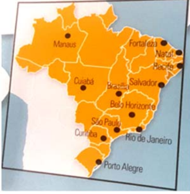
ब्राझील देशाचा नकाशा

राजधानी होय. या राजधानीच्या शहराजवळ सुमारे ४० किलोमीटर अंतरावर नोवो हँबुर्गो हे शहर आहे. तेथे पोहोचण्यासाठी बराच लांबचा प्रवास आम्हाला करावा लागला. मुंबईहून प्रथम आम्ही अबू धाबीला गेलो. तेथून सुमारे १५ तासांचा विमान प्रवास करून साव पावलोला पोहोचलो. आमचा शेवटचा टप्पा होता साव पावलो ते पोर्टो अलिग्रे. तेथील विमानतळाहून टॅक्सीने आम्ही आमच्या हॉटेलात पोहोचलो. सगळा प्रवास ३० तासांहून जास्त झाला.