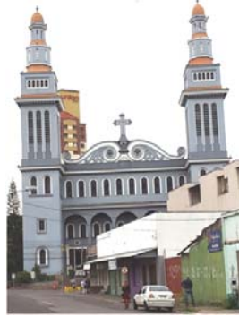
शहरातील एक सुंदर चर्च

कुठेही दिसली नाही. जागोजागी लोखंडी तारेने बनवलेले खोके ठेवलेले आहेत. या खोक्यात लोक सुका कचरा टाकतात. तो नियमितपणे गोळा करून त्याच्यावर प्रक्रिया केली जाते. ओला कचरा घोघरी जाऊन गोळा केला जातो. अशा रीतीने संपूर्ण शहर स्वच्छ राखले जाते.