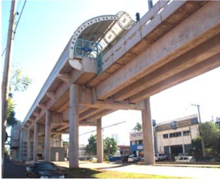
शहरातील मेट्रो रेल्वे

लगेच नोवो हँबुर्गोला पोहोचवता येतात. दोन शहरादरम्यान दळणवळण जलद आणि सोयीचे व्हावे यासाठी नव्याने मेट्रो रेल्वे बांधण्यात आली आहे. सगळ्या महत्वाच्या ठिकाणी स्टेशने बांधून लोकांना कुठेही सहज पोहोचता येईल अशी व्यवस्था केली आहे. मेट्रो रेल्वेचे भाडे एक रियाल सत्तर सेंट एवढे आहे. प्रवासाचे अंतर कितीही असू दे मेट्रोचे भाडे मात्र तेवढेच. एकदा तिकीट मशीनमध्ये घातले की तुम्हाला रेल्वे फलाटावर प्रवेश मिळतो. त्यानंतर इच्छित दिशेने जाणारी गाडी पकडून आपल्याला हवे असेल त्या स्टेशनवर उतरता येते.