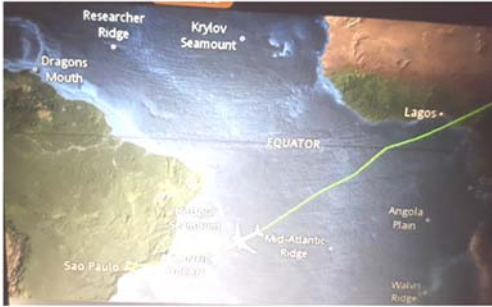
विमान प्रवासाची दिशा

राजधानी होय. या राजधानीच्या शहराजवळ सुमारे ४० किलोमीटर अंतरावर नोवो हँबुर्गो हे शहर आहे. तेथे पोहोचण्यासाठी बराच लांबचा प्रवास आम्हाला करावा लागला. मुंबईहून प्रथम आम्ही अबू धाबीला गेलो. तेथून सुमारे १५ तासांचा विमान प्रवास करून साव पावलोला पोहोचलो. आमचा शेवटचा टप्पा होता साव पावलो ते पोर्टो अलिग्रे. तेथील विमानतळाहून टॅक्सीने आम्ही आमच्या हॉटेलात पोहोचलो. सगळा प्रवास ३० तासांहून जास्त झाला.