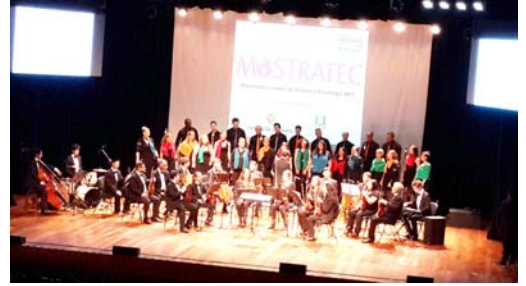
फंडासाव लिबॅरटो संस्थेचा बँड

हा कार्यक्रम प्रदर्शनाच्या ठिकाणीच आयोजित केला होता. मोठ्या मुलांसाठी मात्र हा कार्यक्रम गावातल्याच फीवेल विद्यापीठाच्या सभागृहात (Feevale University Hall) आयोजित केला होता. डोंगरांनी वेढलेल्या या विद्यापीठाचे सभागृह खूप मोठे असून त्यात सर्व आधुनिक सुविधा आहेत. कार्यक्रमाची सुरुवात फंडासाव लिबॅरटो संस्थेच्या बँड पथकाने केली. कानाला गोड आणि मनाला मोहून घेईल असे गीत सादर करून त्यांनी योग्य वातावरण निर्मिती केली.