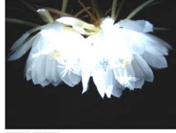
राज्यपुष्प ब्रह्मकुमळ राज्यवृक्ष बुरांस (दोडोडेन्ड्रॉन)

भागिरथी (गंगा), अलकनंदा, मंदाकिनी, पिंडारी, तोन्स, यमुना, काली, न्यार, भिलंगन, शरयू आणि रामगंगा ह्या नद्या या राज्यातून वाहतात. थोडक्यात काय, तर गंगा-यमुनेच्या खोऱ्यांचे डोंगराळ भागातून मैदानी भागात अवतरण होते तेच हे विख्यात स्थान आहे. गहू, तांदूळ, बार्ली, मका, मंडुआ, हंगोरा इत्यादी पीके इथे घेतली जातात. सफरचंद, लिची, आलुबुखार, नास्पती इत्यादी फळेही इथे होत असतात. चुनखडी,