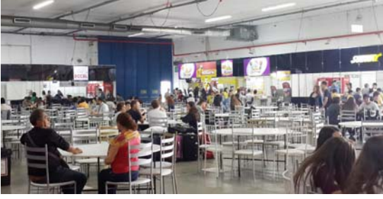
तळमजल्यावरील भोजन व्यवस्था

असे करण्यात आले आहे. बत्तीसाव्या मोस्ट्राटेकचे आयोजन याच संकुलात करण्यात आले होते. दोन मजल्यांवर पसरलेल्या या संकुलात प्रदर्शनीय वस्तू ठेवण्यासाठी पुरेशी जागा आहे. त्याचबरोबर संकुलात एक मोठे सभागृह आणि छोट्या गटाला चर्चेसाठी उपयोगी पडतील अशा लहानलहान खोल्या आहेत. मोठ्या संख्येने लोक प्रदर्शन पाहायला येणार म्हणून त्यांच्या खाण्यापिण्याची सोय व्हावी यासाठी खाद्यपदार्थांचे पुरेसे स्टॉल उभारता येतील अशी व्यवस्था केलेली आहे. सोयीसाठी तळमजल्यावर खाण्याची सोय आणि पहिल्या मजल्यावर प्रदर्शन अशी विभागणी करण्यात आली होती.