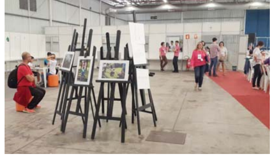
मुलांनी आणि शिक्षकांनी काढलेल्या चित्रांचे प्रदर्शन

मोस्ट्राटेक ही प्रामुख्याने विज्ञान आणि तंत्रज्ञानाची स्पर्धा असते. असे असले तरी त्यातील प्रत्येक प्रदर्शनीय वस्तूचा विज्ञान किंवा तंत्रज्ञानाशी संबंध असलाच पाहिजे असे नाही. विज्ञानाबरोबरच कला क्षेत्राला देखील या प्रदर्शनात सारखेच महत्त्व दिलेले तेथे आढळते. प्रदर्शनात सर्वत्र छान छान चित्रे लावून ठेवलेली असतात. याखेरीज विद्यार्थ्यांनी गोळा केलेल्या वस्तू, त्यांनी बनविलेल्या बाहुल्या, खेळण्या यांनादेखील या प्रदर्शनात स्थान दिलेले होते. काही ठिकाणी तर पेंटिंग्जचेच प्रदर्शन भरविलेले आढळले.