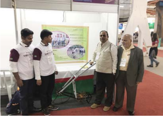
भारतातून नेलेले प्रदर्शनीय उपकरण

एक यंत्र विकसित केले. तेच यंत्र घेऊन हे विद्यार्थी स्पर्धेला आले होते. विषय साधाच होता पण शेतकऱ्यांचा जिव्हाळ्याचा होता. शेतीत पिकणाऱ्या धान्यावर आपण सगळेजण अवलंबून असल्याने या विषयात सगळ्यांनाच रस होता. त्यामुळे प्रदर्शन पाहायला येणाऱ्या अनेक लोकांनी या प्रकल्पाजवळ गर्दी केली.