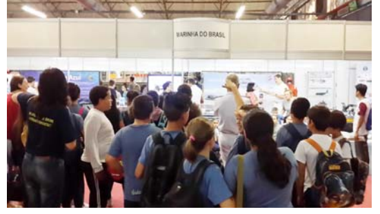
धृवीय प्रदेशात संशोधन करणाऱ्या संस्थेचा गजबजलेला स्टॉल

मोस्ट्राटेकला भेट देणाऱ्या लोकांना शाळकरी विद्यार्थ्यांच्या प्रकल्पाबरोबरच देशात चाललेल्या संशोधन कार्याची माहिती व्हावी असा आयोजकांचा प्रयत्न असतो. त्यासाठी देशातील काही शैक्षणिक आणि संशोधन संस्थांना ते प्रदर्शनासाठी पाचारण करतात. त्यांच्या संस्थेबद्दल माहिती देण्यासाठी लागणारी सुविधा आणि जागा त्यांना उपलब्ध करून दिली जाते. त्यामध्ये फंडासव लिबरटो या संस्थेचा एक स्टॉल असतोच. याखेरीज इतर काही संस्थांचे स्टॉल असतात. बत्तीसाव्या मोस्ट्राटेकचे वैशिष्ट्य हे की, तेथे दक्षिण ध्रुवावर संशोधन करणाऱ्या संस्थेचा स्टॉल होता. या स्टॉलमध्ये या संशोधनाची सुरुवात कशी झाली यापासून सद्यस्थितीत कोणते संशोधन केले जात आहे याची माहिती दिलेली होती. त्यासाठी त्या संस्थेत काम करणारे संशोधक तिथे आले होते. प्रत्यक्ष संशोधकांकडून माहिती मिळत असल्याने या स्टॉलजवळ सतत गर्दी असायची.