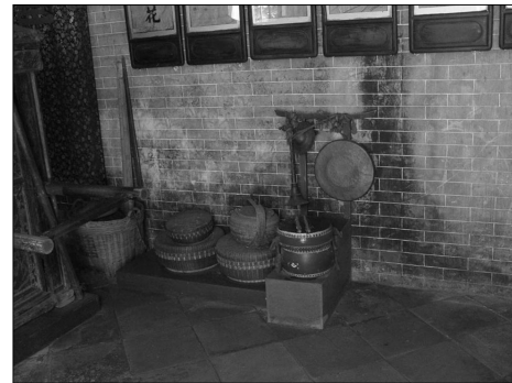
घरातील जुन्या वस्तू

या पर्यटन स्थळात जागोजागी आपल्याला प्रदर्शन पाहायला मिळते. आता काही लोकांनी लहानलहान दुकाने देखील तेथे थाटलेली आहेत. येणारे पर्यटक तेथे खरेदी करताना आढळतात. या वस्तूंमध्ये कारखान्यात तयार होणाऱ्या वस्तूपेक्षा गावातील कलाकारांनी तयार केलेल्या वस्तूंचाच भरणा अधिक असतो. जुनी घरे, जुन्या किंवा ग्रामीण वस्तू असाच या परिसराचा साज आहे.