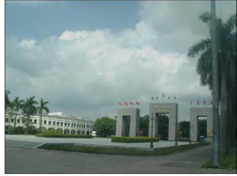
झोगशान गावाचे प्रवेशद्वार

लागतात. रस्त्याच्या मधोमध आणि रस्त्याच्या दोन्ही बाजूला सुंदर झाडे लावलेली आहेत. त्यामुळे संपूर्ण प्रवासात आपण जणू बागेतच आहोत असे वाटते. संपूर्ण रस्ता गुळगुळीत असून कोठेही खड्डा शोधूनदेखील सापडत नाही. त्यामुळे प्रवास सुखाचा झाला. तीन तास गाडी चालवून झाल्यावरदेखील कोणत्याही प्रकारचा थकवा चालकाच्या चेहऱ्यावर जाणवला नाही.