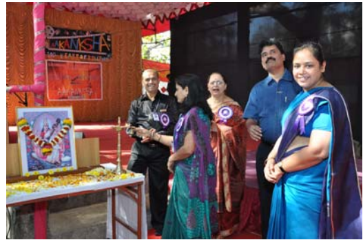
'आकांक्षा २०१३' चे उद्घाटन करताना

दि. २० डिसेंबर २०१२ ते २४ डिसेंबर २०१२ या कालावधीत 'आकांक्षा' चे विविध कार्यक्रम झाले. या वर्षी ही संकल्पना बॉलीवुडची १०० वर्षे ही होती.