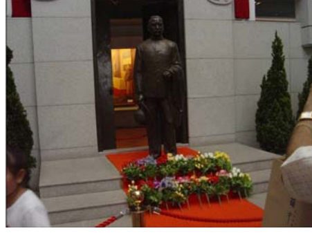
सन यात सेनचा पुतळा

ज्ञोगशान येथील स्मारकाला भेट देऊन आम्ही परतीच्या प्रवासाला सुरुवात केली. परतीच्या प्रवासात आमच्या तोंडी दोनच गोष्टी होत्या. एक तर सन यातसेनचा चीनच्या बांधणीत सहभाग आणि दुसरे म्हणजे स्मारक सांभाळून ठेवण्याची सध्याच्या सरकारची पद्धत. अशा स्मारकाने आपल्या पुढाऱ्याची आठवण तर राहतेच त्याचबरोबर पुढच्या पिढीला प्रेरणा देखील मिळते.