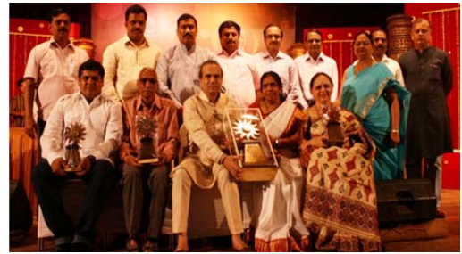
जनकवी पी. सावळाराम पुरस्कार २०१३ चे मानकरी

जीवनाकडे पाहण्याची दृष्टी बदलली की विषयही बदलतात.