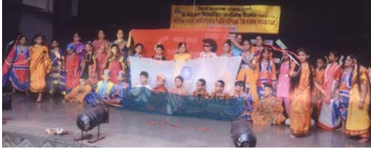
सांस्कृतिक कार्यक्रमातील एक क्षण