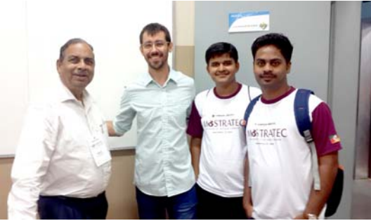
संस्थेच्या माजी विद्यार्थ्यांसोबत घेतलेले छायाचित्र

इलेक्ट्रीकल इंजिनिअरिंग विभागातून बाहेर पडेपर्यंत दुपार झाली होती. आमची हॉटेलला परत जाण्याची वेळ होत आली होती. त्यामुळे बघण्यासारखे बरेच काही असूनदेखील आम्ही संस्थेतून काढता पाय घेतला. तरीही आमची नजर केमिकल इंजिनिअरिंग (Chemical Engineering) विभागाकडे गेली. म्हणून तिथे डोकावून यायचे आम्ही ठरविले. आम्ही तेथे पोहोचलो तर एक माणूस आम्हाला दारातच भेटला. त्याने आम्हाला सांगितले की तो या तंत्रनिकेतनचा माजी विद्यार्थी आहे. त्यांनी या संस्थेत जे काही ज्ञान घेतले त्याचा त्याला जीवनात खूप उपयोग झाला. या संस्थेतून बाहेर पडल्यावर त्याने एका रासायनिक कंपनीत काम केले. सध्या तो फिल्म इंडस्ट्रीमध्ये काम करतो. एका दशकापूर्वी तो या संस्थेतून बाहेर पडला. तरीही त्याला या संस्थेबद्दल अजूनही आस्था आहे. त्याने आम्हाला सांगितले की, काही आंतरराष्ट्रीय पाहुणे संस्थेला भेट द्यायला येणार आहेत असे त्याला कळले. म्हणून तो आठवणीने तेथे आला. त्याच्याशी बातचीत करून आम्हाला संस्थेच्या कार्याची चांगलीच माहिती मिळाली. म्हणून आम्ही त्याच्याबरोबर एक छायाचित्र काढून घेतले.