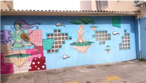
भिंतीवरील आकर्षक चित्र

कॅम्पो बोम उपनगरातून आमची बस थोड्याच अवधीत नोव्हो हॅम्बुर्गो शहरात आली. हे शहर सपाट जमिनीवर नसून उंचसखल भागात वसलेले आहे. रोज आमचा प्रवास हॉटेल ते प्रदर्शन स्थळ असाच असायचा. त्यामुळे शहर कसे आहे आहे याची आम्हाला पुरेशी कल्पना आलेली नव्हती. या निमित्ताने शहर पाहण्याची संधी आम्हाला मिळली. शहर लहान आणि रस्ते मोठे असल्याने वाहतुकीची कोंडी झालेली आम्हाला कुठेही पाहायला मिळाली नाही. लवकरच आम्ही शहर पार करून शहराच्या वेशीवर पोहोचलो. त्यावेळेस आमच्या बसने मुख्य रस्ता सोडला आणि डोंगरावर जाणारा एक वळणावळणाचा रस्ता घेतला. या रस्त्याच्या दोन्ही बाजूला टूमदार असे बंगले होते. सर्वत्र स्वच्छता होती. टेकडीवरून शहर सुंदर दिसत होते. हे पाहण्यात आम्ही एवढे दंग झालो होतो की आमची बस कधी टेकडीवर पोहोचली तेच आम्हाला कळले नाही. बस थांबल्यावर