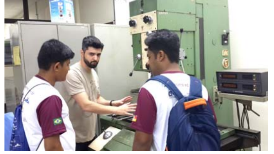
यंत्राची माहिती देताना एक प्राध्यापक

माहिती दिली. या विभागात अनेक प्रकारची यंत्रे आहेत. काहीतर खूपच जुनी आहेत. त्यातील बहुतेक यंत्रे युरोपातून आयात केलेली होती. प्रत्येक यंत्र योग्य स्थितीत ठेवलेले होते. त्यांची नियमित देखभाल करित असावेत असे दिसते.