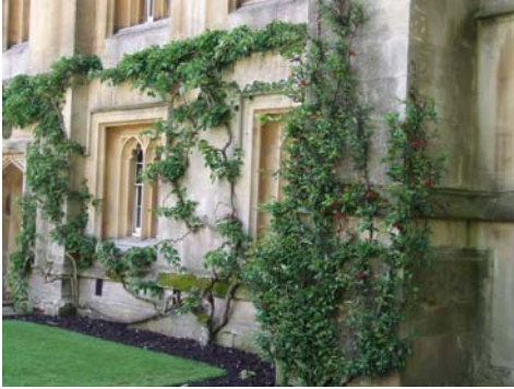
कॉलेजची दगडी इमारत

ऑक्सफर्ड भेटीत एखाद्या कॉलेजला भेट देता आली, तर चांगले होईल अशी इच्छा सहलीत सहभागी झालेल्या विद्यार्थ्यांनी व्यक्त केली. ऑक्सफर्डमधील काही कॉलेजमध्ये शुल्क आकारून आत प्रवेश देतात. पण अशा पध्दतीने आत जाऊन आपल्या हाती फारसे लागत नाही. कॉलेजमधले लॉन आणि दगडी इमारती एवढेच आपल्याला बाहेरून पाहता येते. म्हणून औपचारिक परवानगी घेऊन एखाद्या कॉलेजमध्ये जाता आले तर चांगले; असा विचार आम्ही करीत होतो. योगायोगाने ऑक्सफर्डमध्ये शिकलेल्या भारतीय वंशाच्या एका व्यक्तीशी आमची ओळख झाली. तू कुठे शिकलास असे चारले असता “हर्टफर्ड कॉलेज” असे उत्तर त्याने अभिमानाने दिले. ह्याचबरोबर कॉलेजबद्दल थोडी माहितीदेखील त्याने दिली. त्यावर कॉलेजला भेट देण्याची इच्छा आम्ही व्यक्त केली. तसे पाहता कॉलेजचे शिक्षण संपून त्याला बरीच वर्षे झाली होती. तरीही माजी विद्यार्थी म्हणून त्याला कॉलेजमध्ये प्रवेश होता. त्याचा उपयोग करून त्याने कॉलेजमधल्या आंतरराष्ट्रीय विभागात काम करणाऱ्या अधिकाऱ्यांना गाठले.