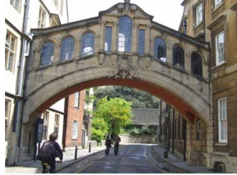
न्यू ब्रिज : हर्टफर्डच्या दोन इमारतींना जोडणारा पूल

भारतातून विद्यार्थ्यांचा गट आलेला असून तो आपल्या कॉलेजला भेट देऊ इच्छितो, असे त्याने सांगितले. त्यांच्या विनंतीवरून आम्हांला भेटीची परवानगी मिळाली. ही भेट खरोखरच संस्मरणीय अशीच होती. ठरल्याप्रमाणे सकाळी नऊ वाजता आम्ही हर्टफर्ड कॉलेजच्या प्रवेश द्वारापाशी पोहचलो. आंतरराष्ट्रीय विभागात काम करणारी एक बाई आमची वाटच पाहात होती. तिने आमचे स्वागत केले आणि एका सभागृहात नेले. तेथे चित्रफितीच्या मदतीने तिने आम्हांला कॉलेजची माहिती दिली. हर्टफर्ड नावाच्या दानशूर व्यक्तीने कॉलेज उभारण्यासाठी मोठी देणगी दिली, म्हणून त्याचेच नाव या कॉलेजला देण्यात आले आहे. तेराव्या शतकात या कॉलेजची स्थापना करण्यात आली. ज्या दगडी इमारतीत आम्ही बसलो होतो, ती ७०० वर्षांहून जुनी आहे. ही जागा अपुरी पडायला लगली म्हणून बाजूलाच नवीन इमारत बांधली. ती रस्त्याच्या दुसऱ्या बाजूला असल्याने एका इमारतीतून दुसऱ्या इमारतीत जाण्यासाठी एक पूल बांधावा लागला. न्यू ब्रीज म्हणून हा पूल ऑक्सफर्ड शहरात प्रसिध्द आहे.