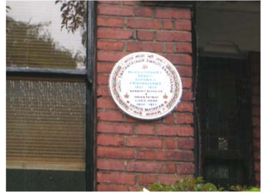
शामजींच्या घरावर असलेला फलक

किलोमीटर पुढे जाऊन उतरलो. थोडे चालल्यावर आम्ही इच्छित स्थळी पोहोचलो. शामजी जेथे राहात त्या घरावर देखील फलक लावलेला आहे. परंतु हा फलक लंडन कौन्सिलने लावला नसून काही भारतीय लोकांनी लावलेला आहे. त्यामुळे, त्याचा आकार आणि रंग दोन्ही नील फलकाहून वेगळे होते. या फलकाचे चित्र खाली दिलेले आहे.