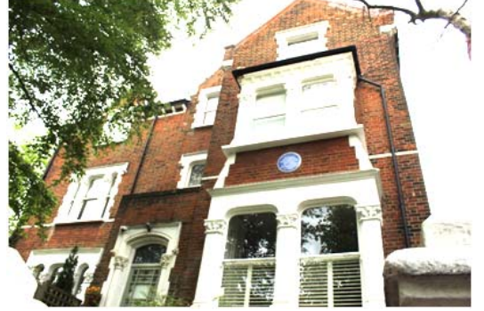
इंडिया हाऊसची सुबक इमारत

इंडिया हाऊसला आवर्जून भेट देतो. ‘६५ कॉमवेल एवेन्यू’ असा या घराचा पत्ता आहे. तेथे जाऊन आम्ही सावरकरांच्या कामाची माहिती देतो. सावरकरांनी देशासाठी मोठे बलिदान दिलेले आहे त्याची माहिती नवीन पिढीला होणे महत्त्वाचे आहे.