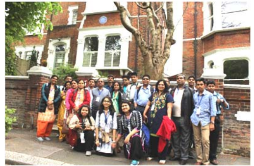
इंडिया हाऊससमोर काढलेला ग्रुप फोटो

प्रयत्न करू लागले. आम्हाला मात्र त्यांना थांबवावे लागले. याचे कारण ही इमारत सध्या खाजगी मालकीची आहे. शामजीनी १९०५ मध्ये ही इमारत घेतली. वसतीगृह चांगल्या तऱ्हेने चालले होते. अनेक भारतीय विद्यार्थी या सुविधेचा फायदा घेऊ लागले होते. परंतु १९०७ मध्ये एकंदर परिस्थिती बदलल्यामुळे त्यांना लंडन सोडून पॅरिसला जावे लागले. पॅरिसला देखील त्यांना राहणे कठीण झाले. म्हणून ते जिनिवाला गेले. तिथेच १९३० साली त्यांच्या मृत्यू झाला. त्यांच्या पश्चात या वास्तूची देखभाल करणारे कोणी राहिले नाही. त्याहीपेक्षा महत्त्वाची घटना १९०९ च्या जुलै महिन्यात घडली. याच वसतिगृहात राहणारे मदनलाल धिंग्रा यानी सर कर्झन वायली यांचा गोळ्या झाडून खून केला. त्यामुळे इंडिया हाऊस स्कॉटलंड यार्डच्या नजरेत आले. येथे चालणाऱ्या घडामोडींवर आधीच त्यांचे लक्ष होते. वायली यांच्या खुनानंतर या घराची आणि तेथे राहणाऱ्या लोकांची झाडाझडती सुरू झाली. इंग्रज अधिकाऱ्यांच्या वक्रदृष्टीमुळे हे वसतीगृह चालविणे कठीण झाले. भारतातून येणाऱ्या विद्यार्थ्यांकडून मिळणारा प्रतिसाद देखील कमी झाला. त्यामुळे इंडिया हाऊस विकावे लागले. १९१० मध्ये रीतसर विक्री होऊन हे घर एका इंग्रज माणसाच्या ताब्यात गेले. त्यामुळे घरात जाऊन ते आतून बघण्याची इच्छा आम्हाला दाबून ठेवावी लागली. परंतु आम्ही घरासमोर एक ग्रुप फोटो मात्र काढून घेतला.