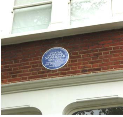
इंडिया हाऊसवर असलेला 'नील फलक'

मे २०१६ मध्ये विद्या प्रसारक मंडळ, ठाणे यांच्या वतीने शैक्षणिक सहल आयोजित करण्यात आली होती. या सहलीत विद्यार्थी, शिक्षक आणि पालक असे सगळे मिळून २४ जण होते. या सगळ्यांना घेऊन आम्ही इंडिया हाऊसला भेट द्यायला गेलो. खरे तर आम्हाला त्यांच्या जन्मदिवशी म्हणजे २८ मेलाच तिथे जायचे होते. परंतु त्यादिवशी दुसरे काम असल्याने दोन दिवस आधीच आम्ही इंडिया हाऊसला भेट देऊन आलो. आमच्या राहण्याच्या ठिकाणाहून इंडिया हाऊस जरा दूरच होते. त्यासाठी आम्ही प्रथम भुयारी रेल्वेने आर्चवे स्टेशनपर्यंत गेलो. त्यानंतर सिटी बसने क्रॉमवेल एवेन्यू जिथे सुरू होतो तिथपर्यंत गेलो. पुढचा प्रवास आम्ही पायीच केला. हा रस्ता जरा वळणाचा आणि चढ असलेला आहे. दोन्ही बाजूला बहुमजली कौलारू घरे आणि त्यामधून जाणारा अरुंद रस्ता असे ते चित्र होते. हळूहळू पावले टाकत आम्ही इंडिया हाऊस जवळ पोहोचलो. रस्त्याच्या दुसऱ्या बाजूला उभे राहून ती वास्तू आणि त्यावरील फलक आम्ही सर्वांना दाखविला. त्यानिमित्ताने सावरकरांचे कार्य त्यांनी स्वातंत्र्य प्राप्तीसाठी केलेले प्रयत्न आणि समाज सुधारणेसाठी घेतलेले परिश्रम यांची माहिती दिली.