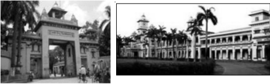
Banaras Hindu University

एखादा विचार रुजवण्यासाठी लागणारी सामाजिक अनुकूलता तयार करण्याची जबाबदारी त्या विचारांची मांडणी करणाऱ्यांवर असते. मोदींच्या (नरेन्द्र मोदी - सध्याचे पंतप्रधान) वाराणसी आगमनामुळे ही जबाबदारी बनारस हिंदू विद्यापीठाकडे आली आहे. 'डावी किंवा उजवी विचारसरणी हवीच' असे मानणाऱ्या दिल्लीच्या 'जवाहरलाल नेहरू विद्यापीठाने' आजवर जे वैचारिक नेतृत्व दिले भारतीय समाजाला, त्याप्रमाणे आता B.H.U. बी.एच.यू.ला (बनारस हिंदू युनिव्हर्सिटी) महत्त्व आल्यास आश्चर्य वाटू नये, असे सांगणारा विशेष वृत्तलेख असा संपादकीय मथळा लाभला" ते पुढे लिहितात. "डाव्या विचारसरणीचा झेंडा खांद्यावर घेऊन मिरवणाऱ्या जे एन यू तील राजकीय अभ्यासक, बुद्धिजीवींना समांतर अशा क्टर उजव्या विचारसरणीचे अभ्यासक बनारस हिंदू विद्यापीठात संघटित होत आहेत. भारतीय राजकारणावर दूरगामी परिणाम करणारी ही घटना आहे." पंडित मदनमोहन मालवीय ह्यांचा आशीर्वाद मिळालेले हे विद्यापीठ राजकीय शास्त्राचे परिवर्तन कदाचित करेल.