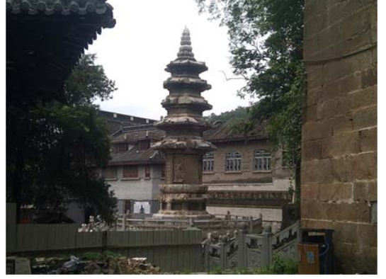
जुन्या काळात बांधलेला पगोडा

अनेक लोक त्या पगोड्याभोवती प्रदक्षिणा घालत होते. अशा प्रकारचे शरीर स्तूप चीनमध्ये काही मर्यादित ठिकाणीच आहेत.