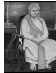
स्वामी दयानंद सरस्वती आर्य समाजाचे संस्थापक