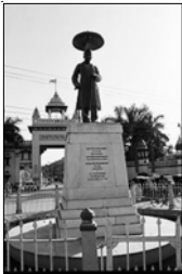
Pandit Madan Mohan Malviya

[Malviya. A prominent lawyer and an Indian independence activist, Malviya considered education as the primary means for achieving a national awakening.]