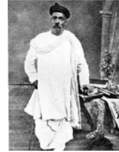
Bal Gangadhar Tilak

सायणाचार्य ह्यांनी वेदज्ञानातील 'Ritualisti' ज्ञानाचाच फक्त पाठपुरावा केला. त्यामुळे वेदांचा चुकीचा अर्थ लावण्याच्या अज्ञानापासून भारतीय जनतेला वाचवण्यासाठी "Go back to vales" म्हणजे वेदज्ञानाकडे स्विरिच्युडाक म्हणजे आध्यात्मिक ज्ञानाकडे वळा अशी घोषणा करावी लागली. ह्या धडपडीचे जेवढे कौतुक व्हायला हवे ते अजूनही झाले नाही. केवळ आर्यसमाजाच्या काही विद्वान मंडळींनी हा भार थोड्या प्रमाणात उचलला.