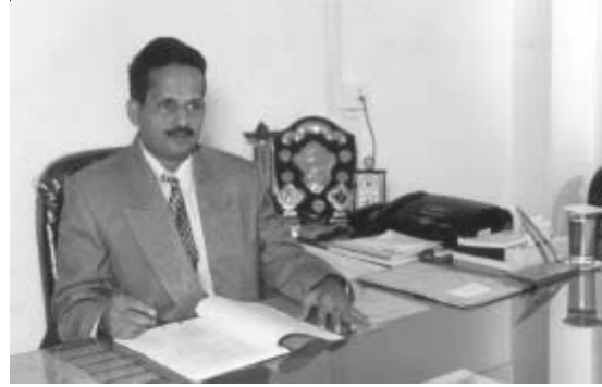
प्रा. दि. कृ. नायक