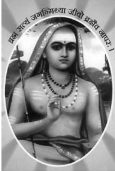
श्रीमत् आद्य शंकराचार्य

हिन्दु परंपरेत स्तोत्रांना अनन्यसाधारण महत्त्व आहे. अनेक स्तोत्रांतील अक्षर नू अक्षर सिद्ध मंत्राप्रमाणे प्रभावी आहे असे नित्यपठण करणारांचे अनुभव आहेत. माणसाला अखंडपणे स्फूर्ती देणारे प्रेरणा स्रोत म्हणजे स्तोत्रे असेही सांगितले जाते. पुराणकाळापासून अनेक स्तोत्रांनी भारताचे आध्यात्मिक साहित्य संपन्न केले आहे. याज्ञवल्क्य ऋषींनी रचलेली स्तोत्रे, नारद पुराणातील स्तोत्रे इ. अनेक स्तोत्रे जशी आजही श्रद्धाभावाने म्हटली जातात, नित्य पठणाने सरावात असतात, तशीच आद्यगुरु श्री शंकराचार्यांची अनेक स्तोत्रेदेखील आज नित्य पठणात असावीत.