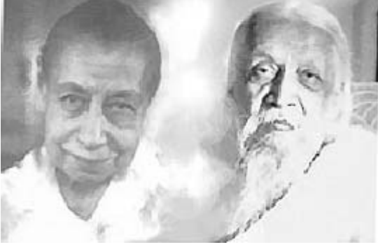
मदर व अरविंद

इंद्रियजन्य ज्ञानाच्या तोकड्या टेलीस्कोप, मायक्रोस्कोप मधून सत्य ज्ञान मिळणे अशक्यप्राय आहे. कारण, ह्या भौतिक ज्ञानाची वर्गवारी ही 'भेदात्मक' ज्ञान Relationist अशी आहे. मग, हे 'एकात्म ज्ञान' कसे मिळणार?