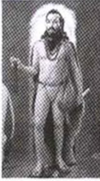
श्री संत समर्थ रामदास

sciousness आहे. मग तिच्या या रथाला 'अरुण अश्व' कोणते?