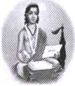
श्री संत ज्ञानेश्वर महाराज

अगदी अलीकडेही, पैठणच्या धर्ममार्तंड ब्राह्मणांनी ज्ञानेश्वर प्रकृति चतुष्टयाला, वेदांचे अधिकार नाकारले व शेवटी ज्ञानेश्वरांनी 'रेड्याच्या मुखातून वेद म्हणावयाला लावले.'"