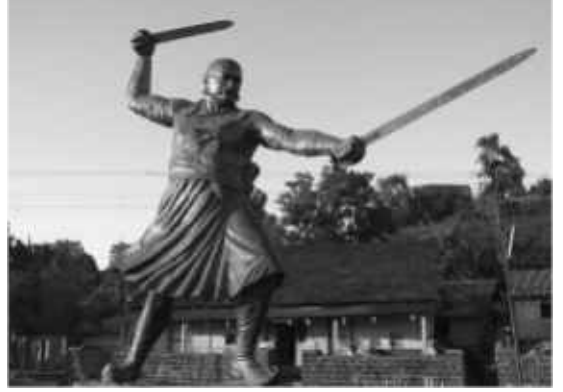
बाजी प्रभू देशपांडे

अशा कसोटीच्या क्षणी तानाजी मालुसरे, बाजी प्रभू देशपांडे वगैरेंनी दाखवलेलं शौर्य आणि देशनिष्ठा त्यांना कौतुकास्पद वाटली. अशा प्रकारची गुणसंपदा असलेली माणसंच राष्ट्रकार्य पुढे नेत असतात. आणि म्हणून अशी माणसं पुनः पुनः समाजात निर्माण व्हायची असतील तर मुळात समाजाने अशा गुणांची चहा करणे आवश्यक आहे. अशा गुणवंतानाही मानाचं स्थान द्यायला हवं अशा प्रकारच्या भावनांनी आणि विचारांनी प्रेरित होऊन-