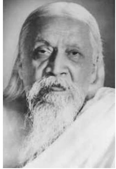
महायोगी अरविंद घोष

दिले, हे सांगत होतो; पुढे मला 'अन्न' ह्या शब्दाची बीजात्मक, व्यापक, वैदिक व तैत्तरीय उपनिषदातील (बीज) संकल्पना सांगावयाची होती.