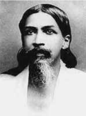
महायोगी श्री अरविंद घोष

महायोगी श्री अरविंदाचा जन्म १८७२ मध्ये बंगालमधील एका सधन कुटुंबात झाला. वयाच्या ६ व्या वर्षापासून २० व्या वर्षापर्यंत १४ वर्षे त्यांनी इंग्लंडमध्ये राहून शिक्षण घेतलं. इ.स. १८९३ मध्ये ते भारतात परत आले. १८९३ ते १९०५ पर्यंत १२ वर्षे त्यांच वास्तव्य बडोद्यात होते. याच काळात श्री अरविंदांचा मराठी भाषेशी, मराठी संस्कृतीशी आणि अनेक मराठी माणसांशी संबंध आला. महाराष्ट्राचा इतिहास आणि मराठी बाणा याविषयी त्यांना वाटणारी आत्मीयता त्यांच्या लिखाणात अनेक ठिकाणी आपणांस दिसून येते. जीवनाची प्राथमिक जडणघडण आणि सर्व शिक्षण इंग्रजी भाषेतून आणि तेही पाश्चिमात्य वातावरणात राहून घेऊनही भारतीय संस्कृती आणि भारतीय विचारधारा