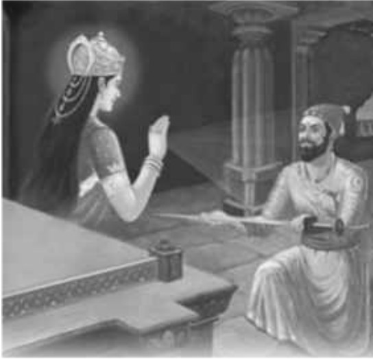
छत्रपती शिवाजी महाराज

श्री अरविंदांनी बाजी प्रभू देशपांडेच्या शौर्यकथेवर अत्यंत प्रभावी भाषेत ५०० ओळींची एक दीर्घ कविता लिहिली, बाजी प्रभूला, त्यांच्या शौर्याला, आणि देशनिष्ठेला श्री अरविंदांनी इंग्रजी भाषेत अमरत्वाच स्थान प्राप्त करून दिलं. त्या तेजस्वी काव्यातील शब्दसामर्थ्याची ओळख श्री शिवाजी सावंतानी एका लेखांत करून दिली आहे. पावनखिंड लढवण्याच कार्य आपल्या शिरावर घेताना तानाजीला उद्देशून बाजीप्रभू म्हणतात -